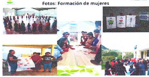
Fotos: Formación de mujeres